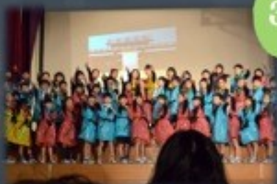
「にん・ニン・忍者」