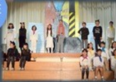
「キャッツ・ストリート」