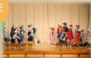
「えんそくにいくんだ」