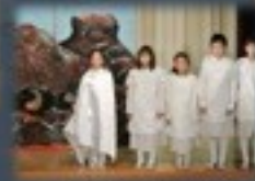
三蔵法師と悟空の厳しくも愉快な修行の旅。衣装や小道具にまでこだわって、とても素敵でした。