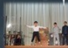
最初は仲の悪かった野良猫と飼い猫。最後は力を合わせて仲間を救い出し、友情が芽生えました。