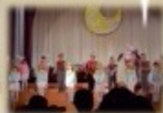
うさぎさんも、たぬきさんも、おおかみさんも、とっても上手にダンスを踊ることができました。