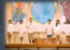
不思議な世界に迷い込んだ主人公ピコ。友達の大切さ、親子の絆を描く感動のストーリーでした。