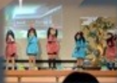
楽しい忍者の修行がたくさん出てきました。なまけ忍者にはご注意を...