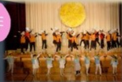
「まん月おどり大会」