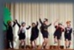
どうしても遠足へ行きたい1年生たち。風や雨と元気がいっぱい戦いました。